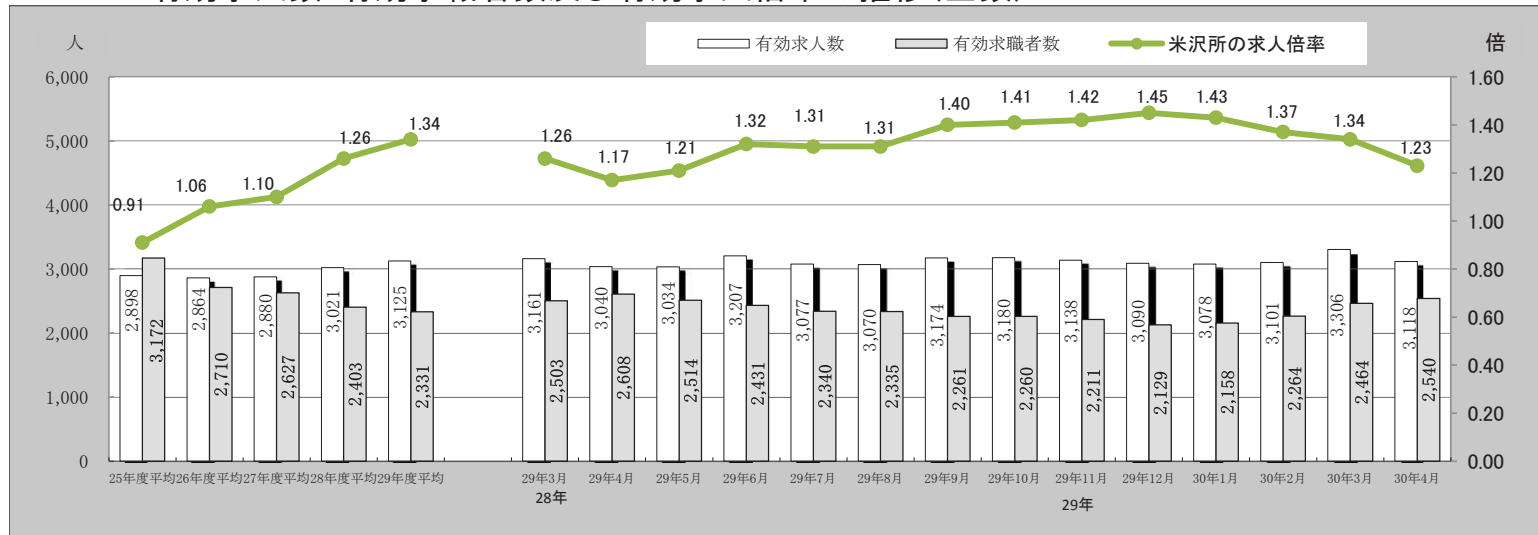
有効求人数・有効求職者数及び有効求人倍率の推移(全数)

・この資料は、置賜地区雇用対策協議会HP【 http://okitamakotaikyuu.jp/ 】に掲示しております。